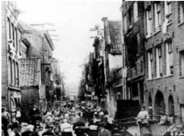
De Joden Houttuinen rond 1890

Dit waren heel andere mensen! Ongeletterde boeren, zeer strikt in hun geloof en in het